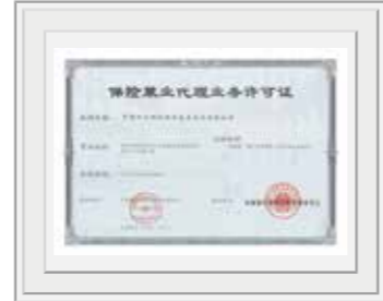
中国保险监督管理委员会向中国四达颁发 《保险兼业代理许可证》，批准我公司保险兼业代理业务资格