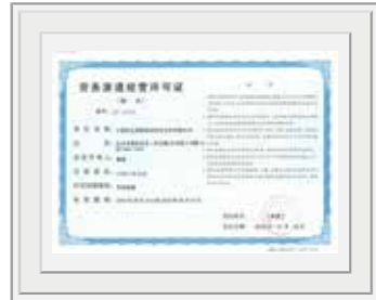
北京市劳动和社会保障局向中国四达 颁发《劳务派遣资质证书》，批准我公司开展劳务派遣业务