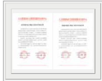
人力资源和 社会保障部教育培训中心授权中国四达合作开展 “养老护理员（高级）”、“母婴护理员（高级）”职业培训