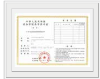
广东省人力资源和社会保障厅向中国四达 颁发《民办学校办学许可证》，批准我司办学