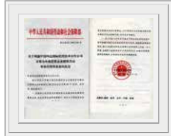
劳动和社会保障部批复同意中国四达 开展为外商投资企业提供劳动事务代理等业务