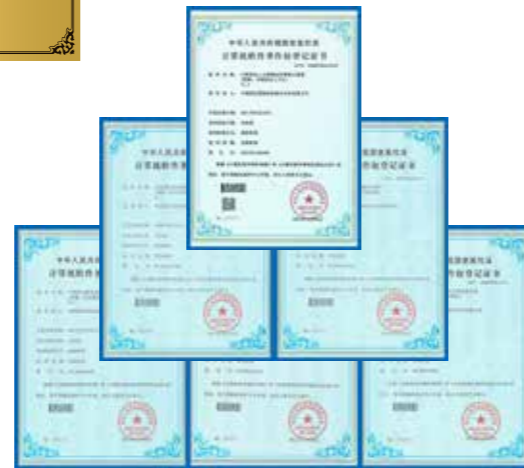
计算机软件著作权登记证书