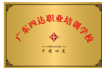
广东四达职业培训学校