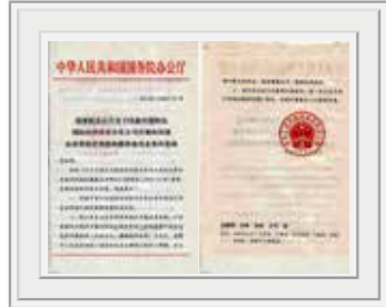
国务院向劳动部发复函同意 中国四达国际经济技术合作公司 开展向外国企业常驻代表机构提供雇员的业务